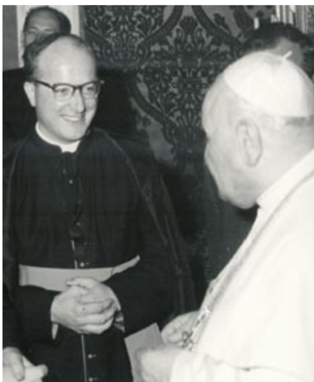
Qui sopra incontro di Mons. Bonicelli con Papa Giovanni. Sotto il Nunzio Apostolico Roncalli all'uscita della Chiesa di Vilminore nel 1948: dietro di lui da sinistra l'Arciprete Don Gritti, il Vescovo Bernareggi e Don Gaetano Bonicelli

vota ‘popolare’ anche perché non lo rassicurano per nulla le squadre di camicie nere che ‘infieriscono contro le sedi del partito popolare’ (p.164-165).