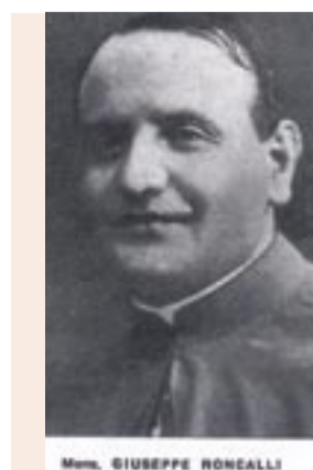
Mons. GIUSEPPE RONCALLI